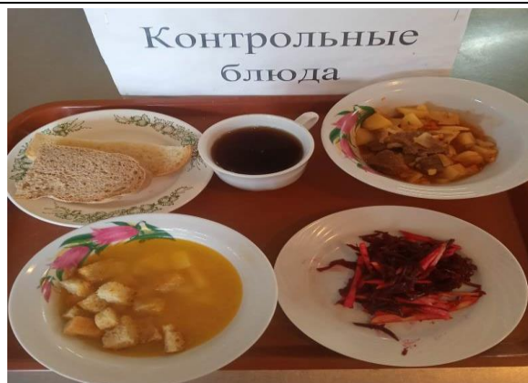
Обед для учащихся 1-4 кл. с ОВЗ