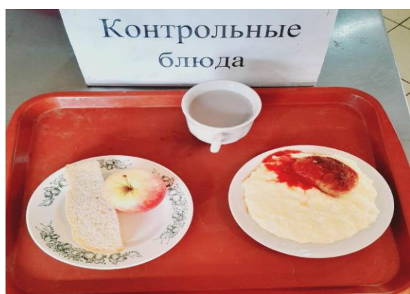
Завтрак для учащихся 1-4 кл.