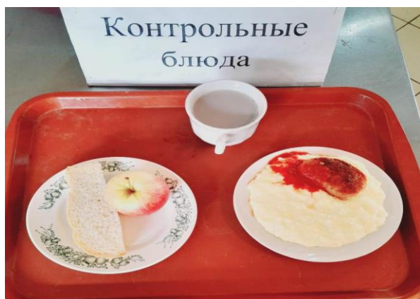
Завтрак для учащихся с ОВЗ