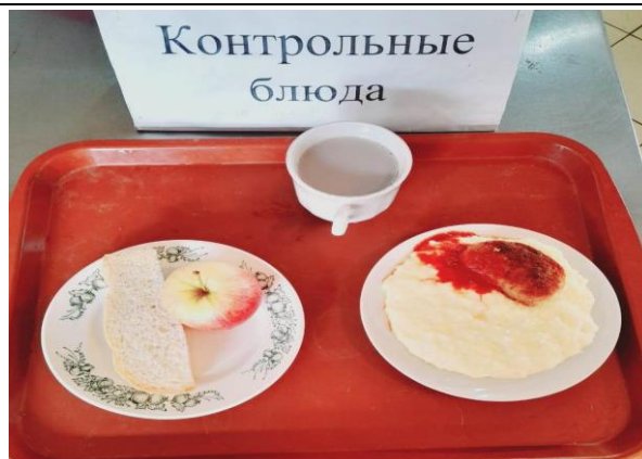
Завтрак для учащихся из многодетных семей