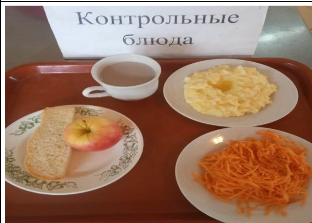
Завтрак для учащихся, питающихся за счёт родительского взноса