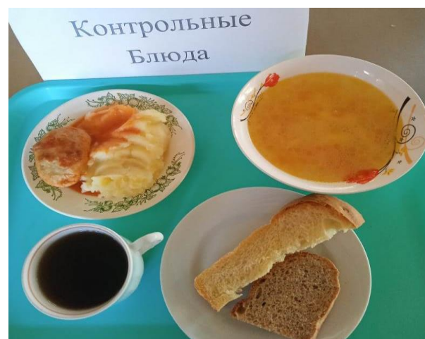
Обед для обучающихся 1-4 кл. (ОВЗ)