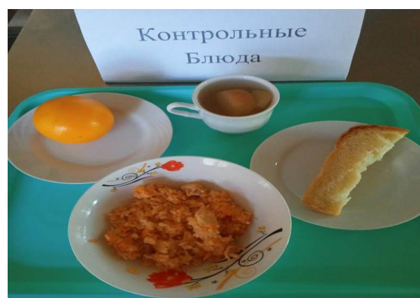
Завтрак для обучающихся из ММО и ОВЗ (5-11 кл.)