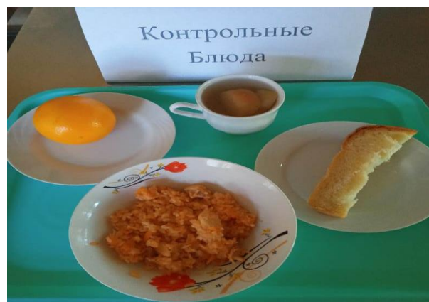
Завтрак для обучающихся 1-4 кл. (льготное питание)