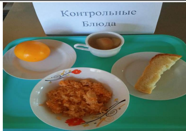
Завтрак для обучающихся 1-4 кл. (ОВЗ)