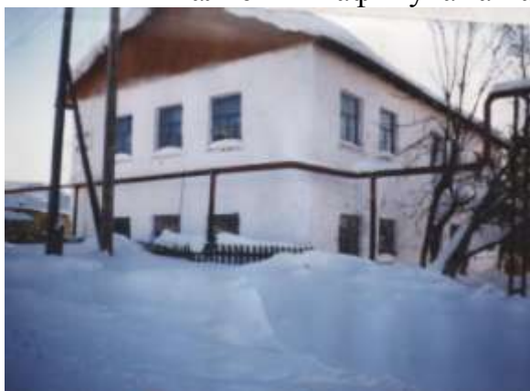
Здание восьмилетней школы