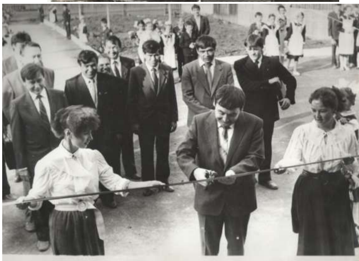
1988 год вошел в историю села Кальтево, как год открытия Кальтевской средней школы Татышлинского района.